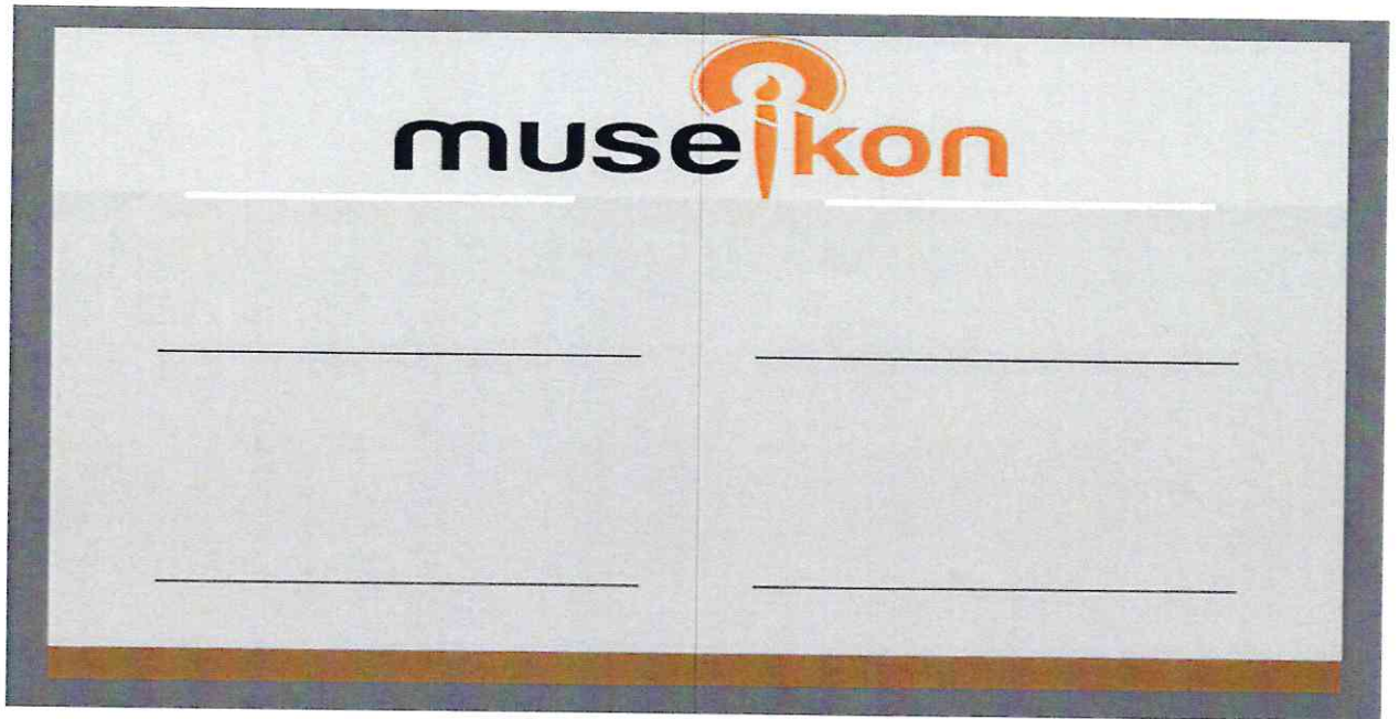
Vitrină - Față