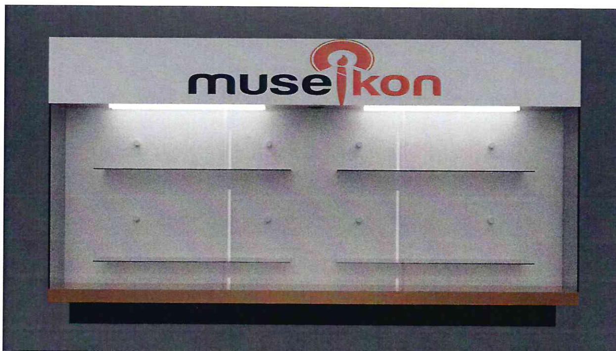
Vitrina - Față