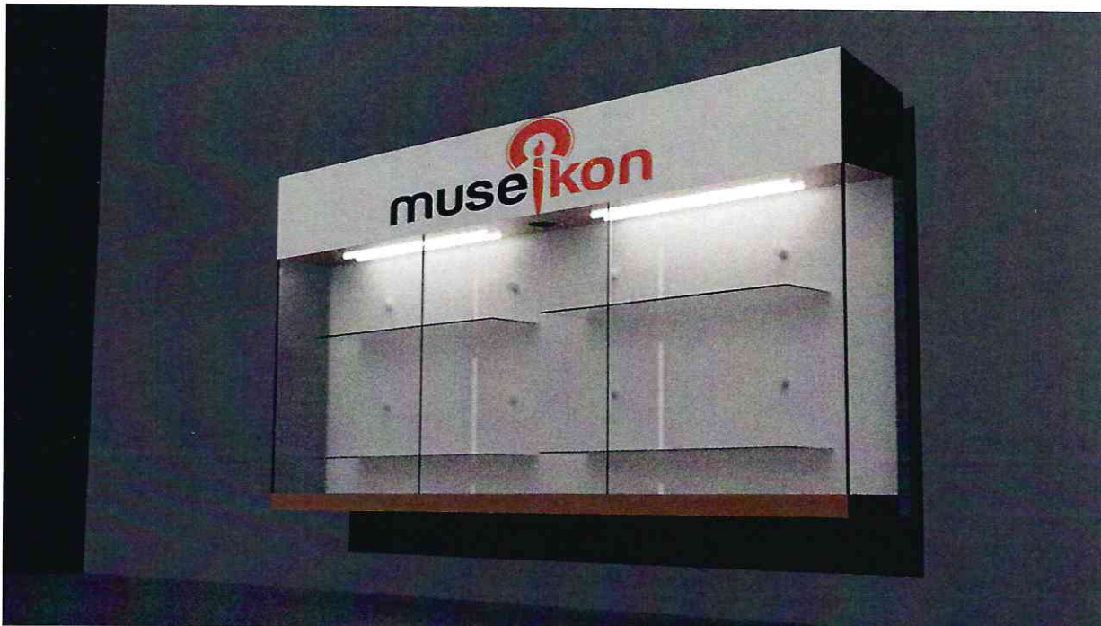
Vitrina - Profil

Imagini orientative vitrină exterioară Museikon